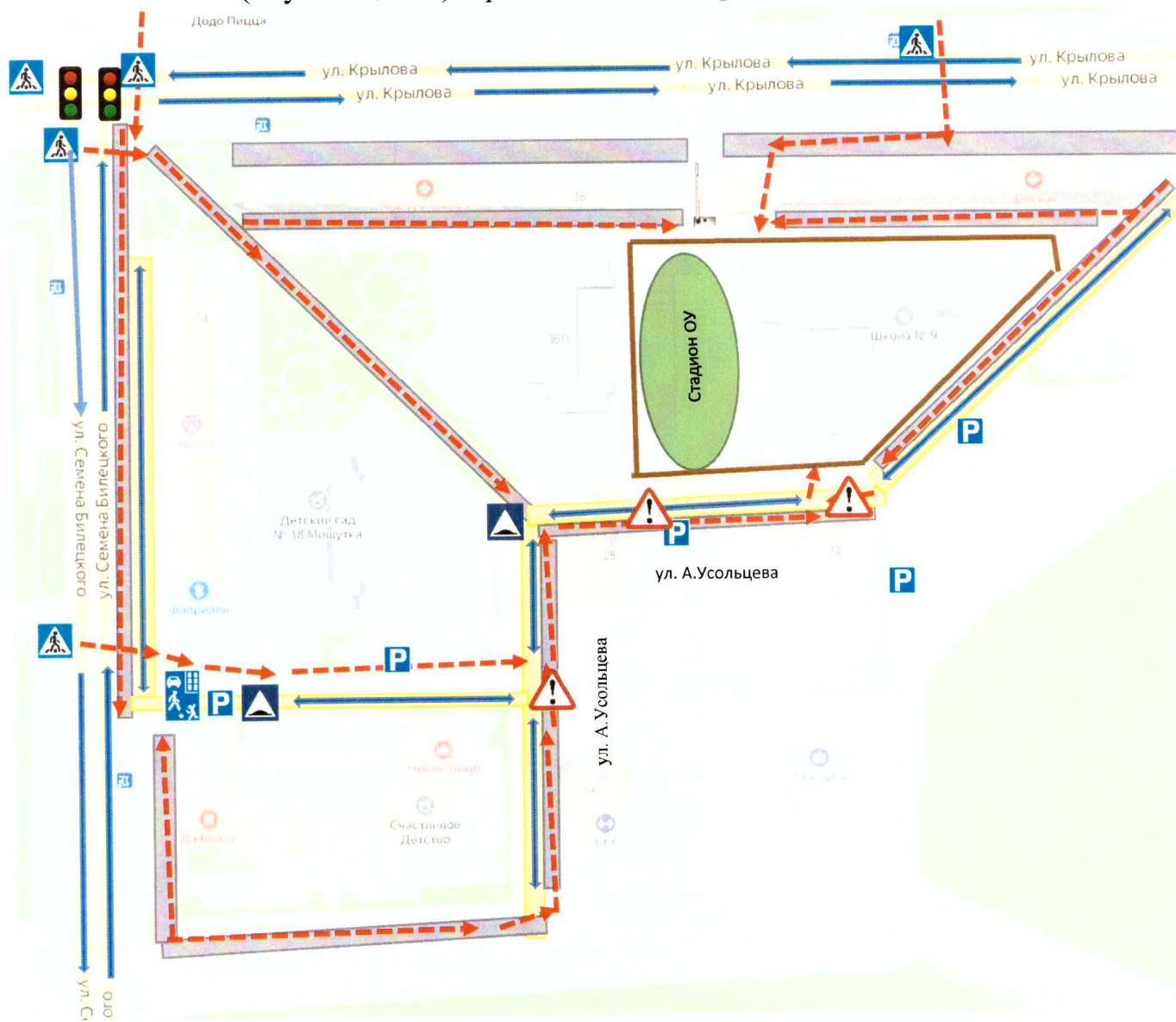
Описание схемы организации дорожного движения в непосредственной близости от МБОУ СШ №9